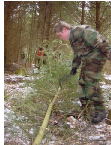
Wir alle fangen mal klein an (mit dünnen Stämmchen)

- die Beobachtung der Forstarbeiter beim Fällen großer Bäume