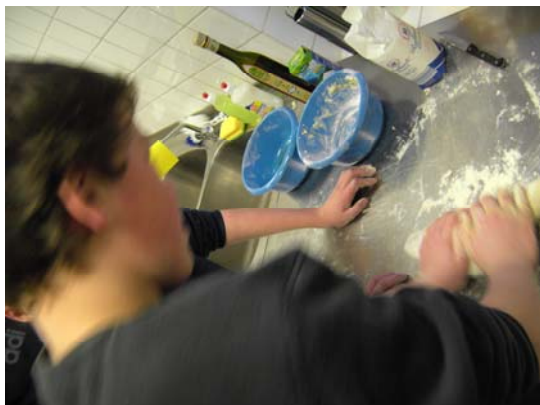
Dass Hefeteig so anstrengen kann!

Und der Rest der Freizeit wurde weitgehend im Freien verbracht, die Zimmer waren eigentlich gar nicht interessant, im Gegensatz zu vielen anderen Klassenfahrten!