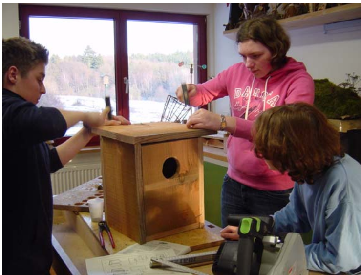
So gefällt's auch den Vögeln!

Das Rahmenprogramm bestand im Wesentlichen aus Küchendienst. Die mitgebrachten Nahrungsmittel mussten von den Schülern selbst zubereitet werden. Tische decken und abräumen, spülen, putzen und aufräumen – das alles nahm viel Zeit in Anspruch.