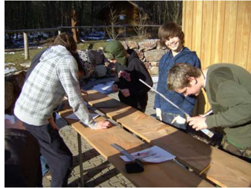
Wie war das noch in AL 7 mit Aufmaß, Werkzeugen, ....?