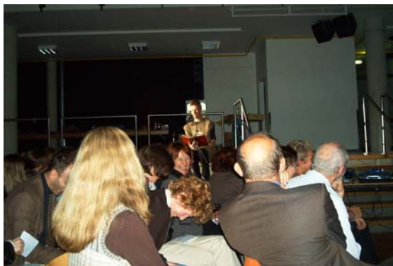
„57 Tutörtchen für die Speisung der 900“

Sie erlebten ihre Schule wieder einmal aus einer anderen Perspektive und bekamen auch selbst den Spiegel vorgehalten, denn jeder kann für einen Programmpunkt gut sein!